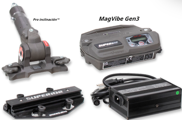
Placa de montaje macho QAS™