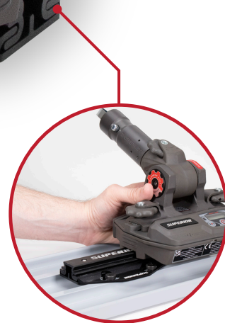
Incluye QAS™ macho Placa de montaje