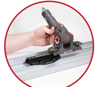
Incluye QAS™ macho Placa de montaje