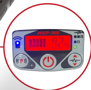
Batería LED Indicador